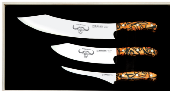
1999 3 so, Griff: Spicy Orange