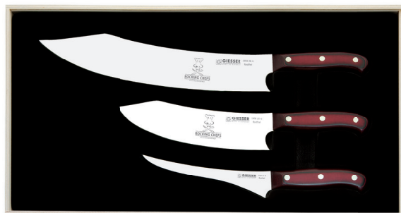
1999 3 rc, Griff: Rocking Chefs