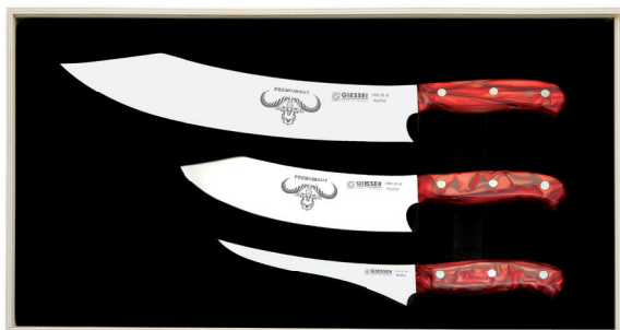
1999 3 rd, Griff: Red Diamond