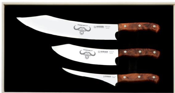
1999 3 tol, Griff: Tree of Life, Thuja