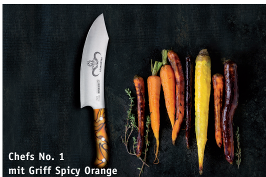
Chefs No. 1 mit Griff Spicy Orange