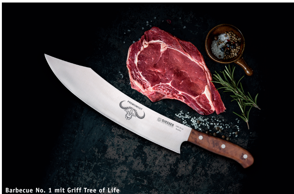
Barbecue No. 1 mit Griff Tree of Life